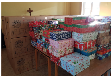
Wichtelfrauen & Päckchen, Fotos © Kristin Uhlig