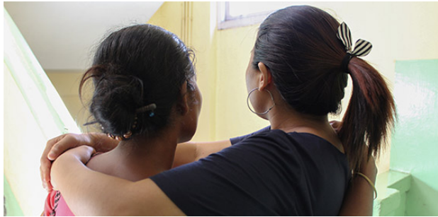
Bild: Diese Christin aus Indien (links) wurde gefesselt und schwer geschlagen, weil sie sich zu Jesus bekennt

die Vergewaltigungen auf. Wir erfuhren, dass Häftlinge ohne Fürsprecher außerhalb des Gefängnisses vieles erleiden mussten.“ Sie waren im März 2009 verhaftet worden, als sie ca. 20.000 Neue Testamente in Teheran verteilten. Weil die beiden sich vom Islam abgewandt und eine Hauskirche gegründet hatten, drohte ihnen die Todesstrafe. Internationale Proteste sowie eine von Open Doors gestartete Gebetskampagne führten zu ihrer Freilassung nach acht Monaten.